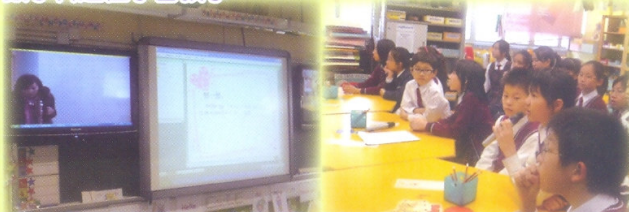
國內資深與數導師透過實時轉播與我們與數班尖子作直接交流