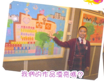
我們的作品漂亮嗎?