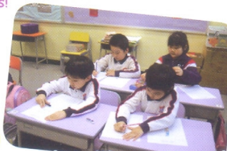
Students: We can write neatly and tidily!