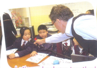
Let's read a rhyme together!