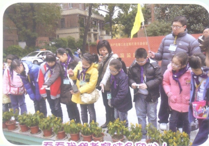
看看我們考察時多留心！