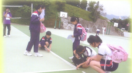
透過參與數學遊踪寫作評量活動，同學能把課堂中所學所得，應用到實際的生活環境。