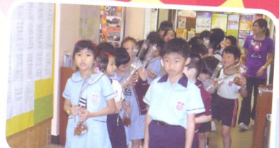
學生們準備向老師致送鮮花及禮物