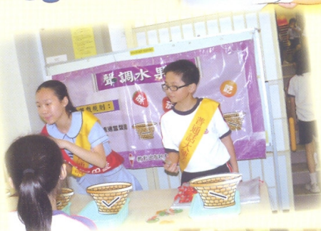
同學於小息時間進行遊戲學習