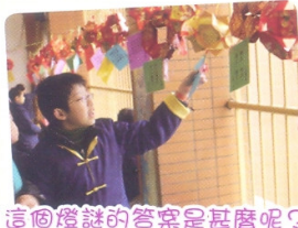
「這個燈謎的答案是甚麼呢？」