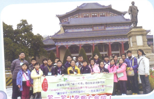
笑一笑！來個大合照！