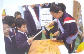
What an exciting fishing game!