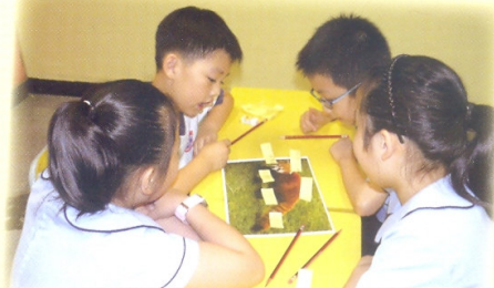
同學能以普通話進行小組討論