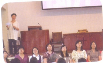
家長代表帶領全校同學向老師高歌一曲《良師頌》！

本校家教會於五月份舉行「家長也敬師活動」，藉以弘揚師道，讓家長向教導他們子女成材的老師致以深切的謝意。