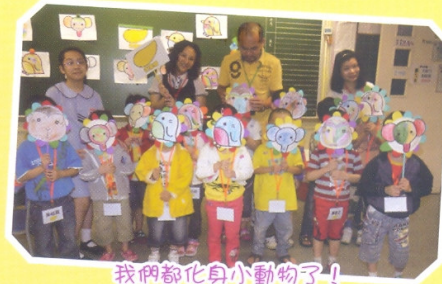
我們都化身小動物了!