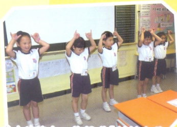
由本校的小一生組成「羊羊大軍」，向幼稚園小朋友示範羊羊操。

本校首次舉辦多元智能幼小體驗課程，於五、六月共舉行四次，反應極之熱烈，共得觀塘區 11 間幼稚園共 140 多名 K2 及 K3 學生報名參加。課程進行期間，除歡迎家長陪同上課，亦同步舉行家長講座，每次皆超過 100 名家長出席。