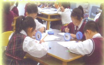
同學積極地進行數學科小班分組學習（課題：時間）