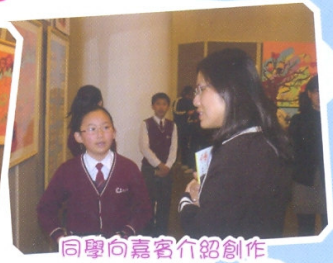
同學向嘉賓介紹創作的意念