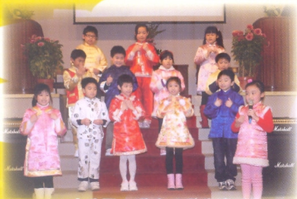
一班精靈活潑的同學為我們表演「童」領三字經

我們於元宵佳節當天舉行「華服慶元宵」活動，同學們穿上漂亮的華服，於操場猜燈謎、玩英語攤位遊戲、製作小手工，非常熱鬧！