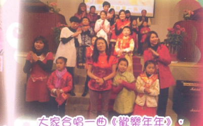
大家合唱一曲《歡樂年年》，真是喜氣洋洋！