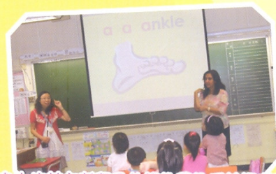
由本校英文老師及外籍教師教授英語拼音