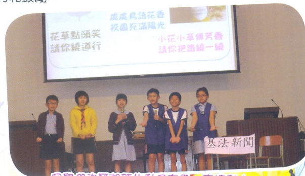
同學們的匯報既生動又有趣，真精彩！