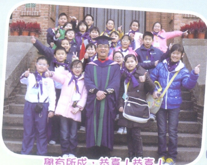
學有所成，恭喜！恭喜！