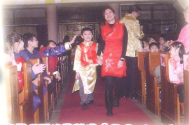
家長們更粉墨登場「行 Catwalk」！