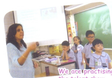
We are practising hard for the talent show.