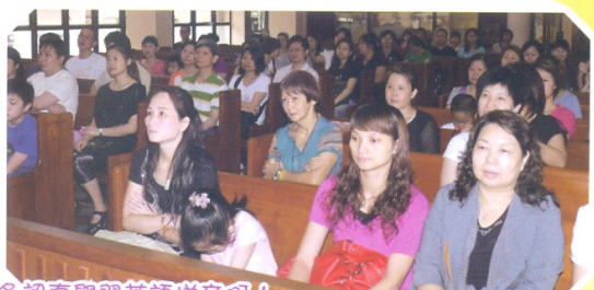
家長們多認真學習英語拼音嘍!