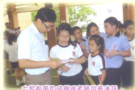
大家都爭取時間跟老師說普通話