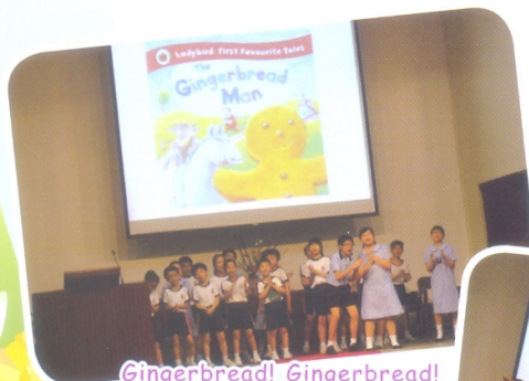
Gingerbread! Gingerbread! We love Gingerbread!

This year, the English Drama group is going to put on a play "The Gingerbread Man" on the talent show. Elites from P.2 to P.5 are recruited to join the group. They work really hard and are very enthusiastic about the play they are going to perform. We are looking forward to seeing their performance. Good show, mates!