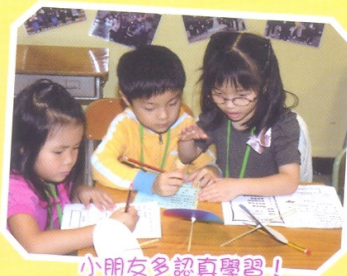
小朋友多認真學習!