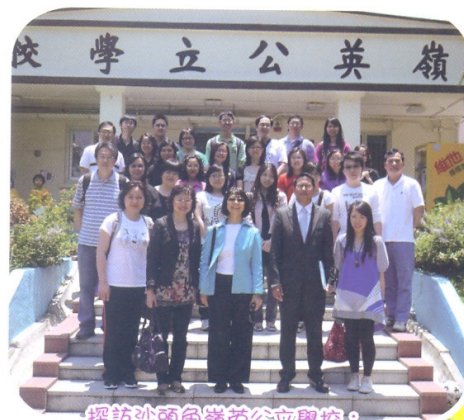
探訪沙頭角嶺英公立學校，交流如何建立正面文化