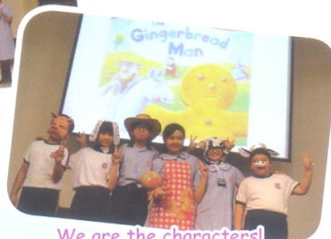
We are the characters!