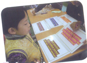
The fongue twister activity is very popular.