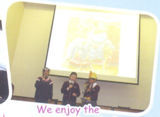
We enjoy the storytelling time!