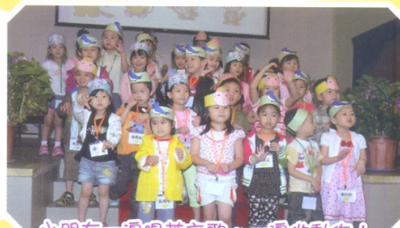
小朋友一邊唱英文歌，一邊做動作!

小朋友經過 3 天的學習，於最後一天的畢業禮中表演英語話劇，看看小朋友們多麼的精靈活潑!