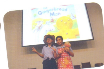
The Old Man and the Old Woman.