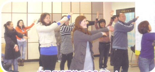
家長們跳讚美操時多投入！

本校的家教會積極舉辦不同的活動，家長們都十分踴躍參與。家教會的活動可謂動靜皆宜，既有學習如何教養子女的講座、工作坊，亦有活力十足的讚美操活動、環保實用的潤唇膏製作班，令家長寓學習於娛樂。