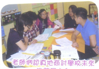
老師們認真地商討學校未來的發展方向