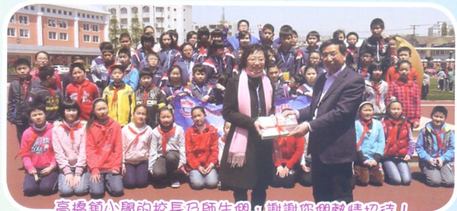
高橋鎮小學的校長及師生們，謝謝您們熱情招待！