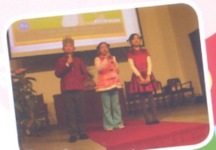
P.5 pupils are reading a story to us. The story is really interesting!

我們於元宵佳節當天舉行「華服慶元宵」活動，同學們穿上漂亮的華服，於操場猜燈謎、玩英語攤位遊戲、製作小手工，非常熱鬧！