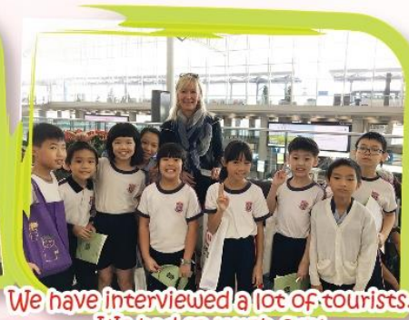
We have interviewed a lot of tourists. We had so much fun!