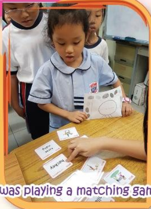
I was playing a matching game!