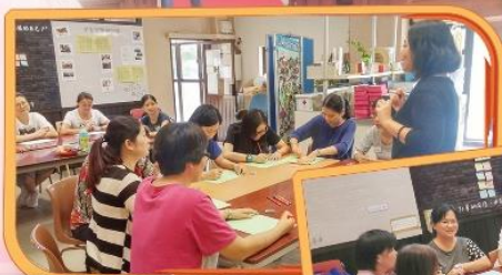
明愛向晴軒的藝姑姐耐心講解，家長們都好認真呢!