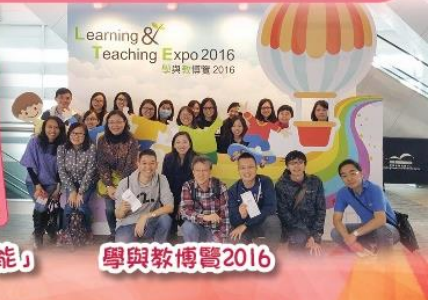
本校教師發展日 題為「發展教師領導才能」