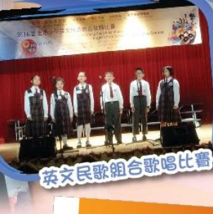
英文民歌組合歌唱比賽