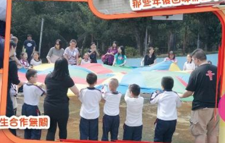
家長、教師、學生合作無間