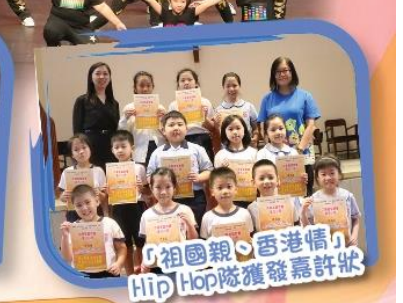
「祖國親·香港情」 Hip Hop隊獲發嘉許狀