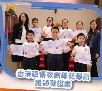
香港資優教育學苑學員 獲頒發證書