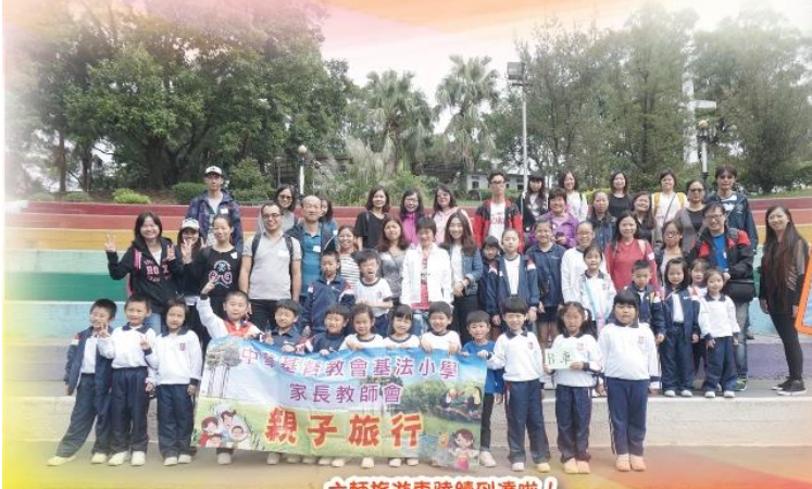
六輛旅遊車陸續到達啦!