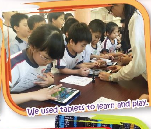
We used tablets to learn and play.