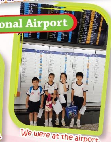
We were at the airport.