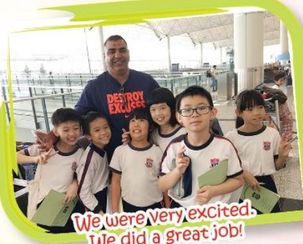
We were very excited. We did a great job!