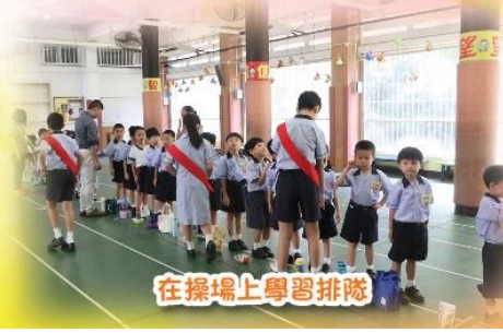
在操場上學習排隊