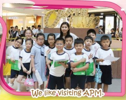
We like visiting APM.