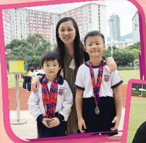
校長也和我們一起分享得獎的喜悅