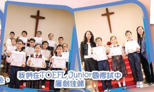
我們在TOEFL Junior國際試中 屢創佳績