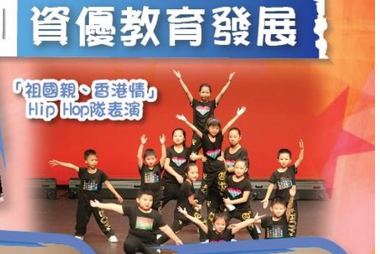
「祖國親·香港情」 Hip Hop隊表演