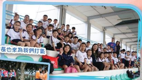
校長也來為我們打氣