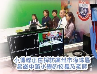
小傳媒正在採訪廣州市海珠區 昌崗中路小學的校長及老師