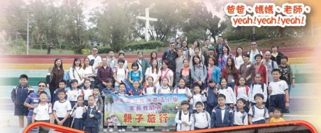
爸爸、媽媽、老師、yeah! yeah! yeah!

2016年11月12日是本校家教會親子旅行的大日子。六輛旅遊車載著三百多名家長及師生，浩浩蕩蕩前往粉嶺浸會園大玩一天。那天天朗氣清，大家都玩過痛快！