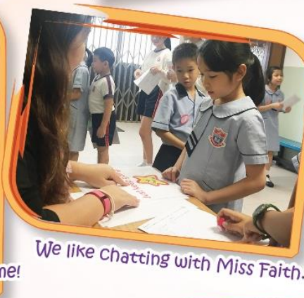
We like chatting with Miss Faith.