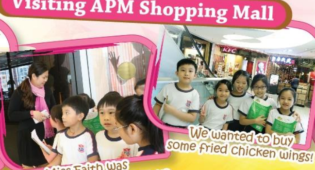
Miss Faith was introducing some shops to us.