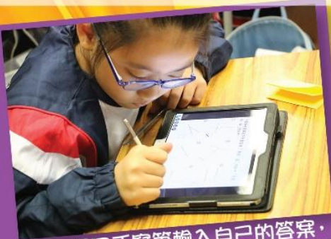
運用手寫筆輸入自己的答案， 分享給全班同學