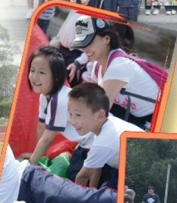
有爸爸陪我玩，個個笑不停