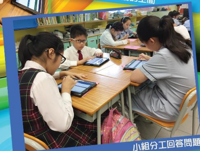
小組分工回答問題