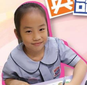
I was designing my own medal.