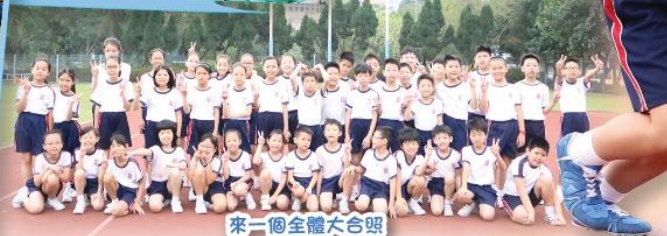
來一個全體大合照