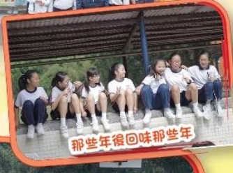
那幾年後回味那幾年