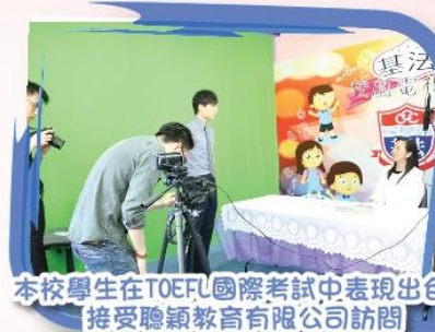
本校學生在TOEFL國際考試中表現出色， 接受聰穎教育有限公司訪問