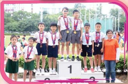
獲得獎項十分喜悅