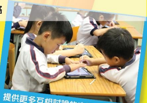
提供更多互相討論的空間