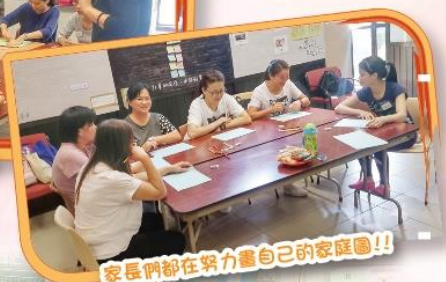
家長們都在努力畫自己的家庭圖!!