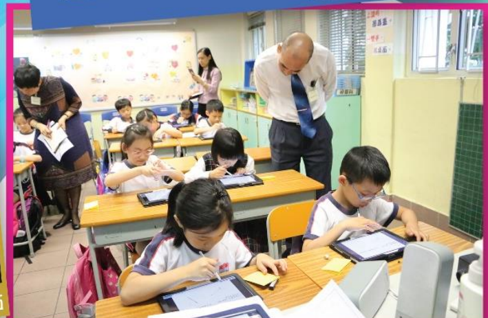
國內校長到本校參觀電子學習課