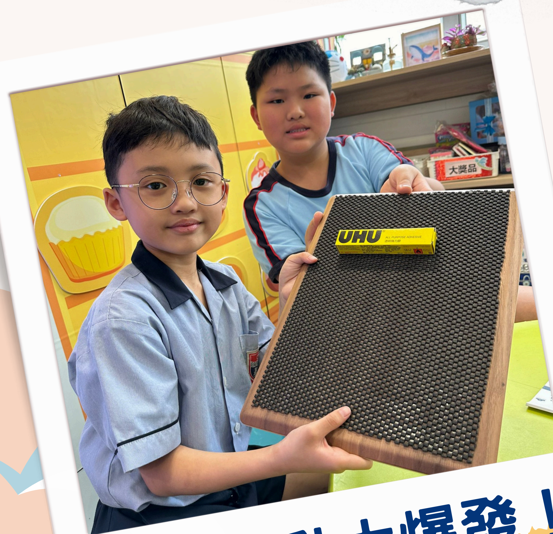
愛心行動大爆發！ 製作防滑托盤