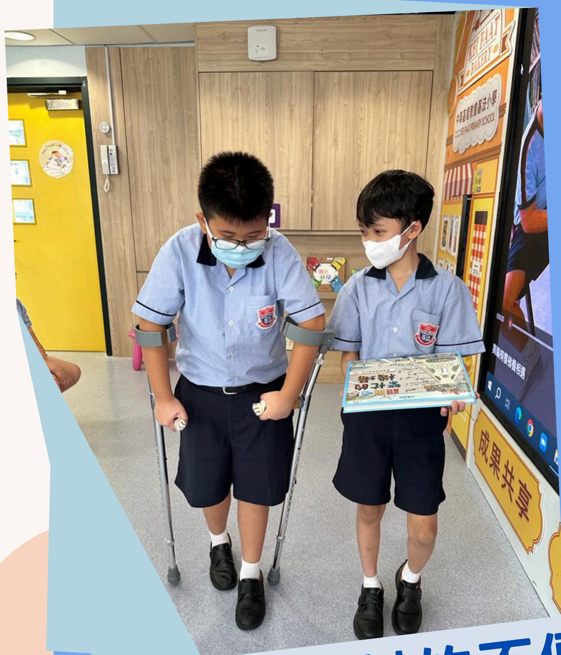
感受使用拐杖的不便