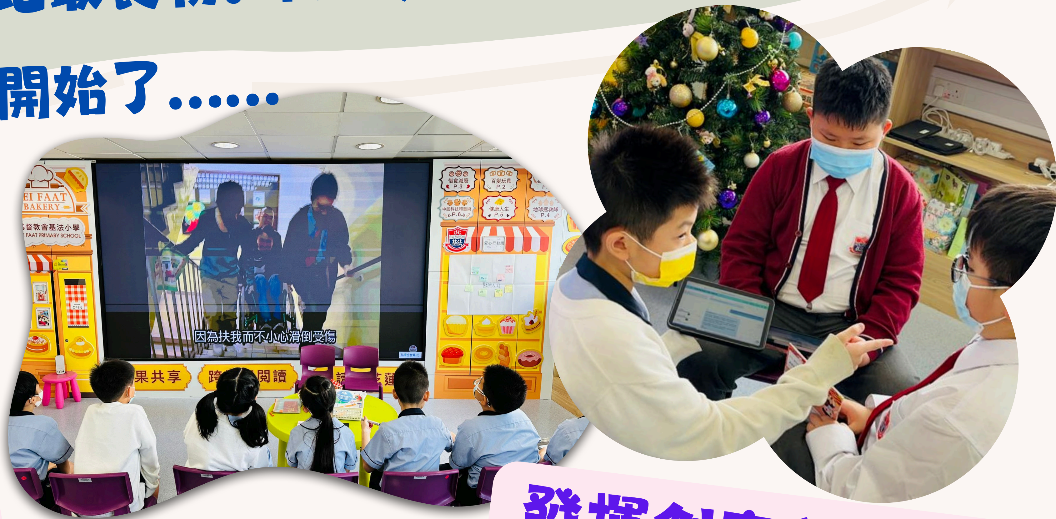
發揮創意積極討論