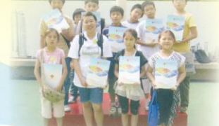
少年警訊之國民教育訓練