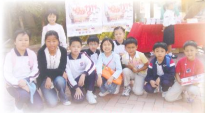
扶貧活動：拼出未來