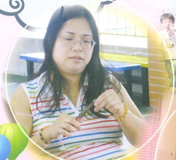
緣聚一刻：串珠活動