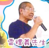
雷禮義先生：奧林匹克講座