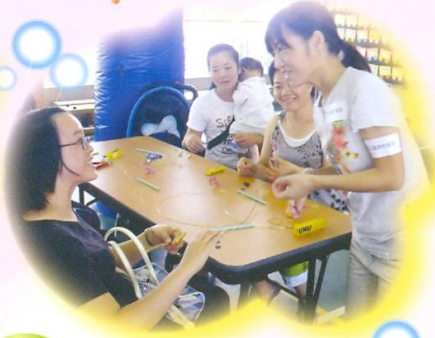
緣聚一刻：飾物製作