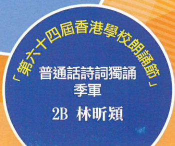
「第六十四屆香港學校朗誦節」 普通話詩詞獨誦 季軍 2B 林昕穎