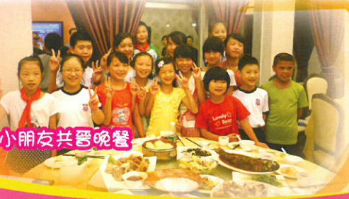
與廣州的小朋友共晉晚餐

有機會參與大型匯演，有機會與不同地方師生交流，有機會接觸不同的文化，有機會訪問來自不同地方的不同人物，還有機會接受訪問……這次旅程，雖然短暫，但獲益良多。