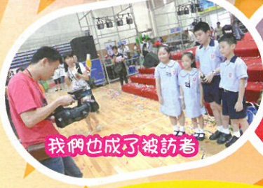
我們也成了被訪者