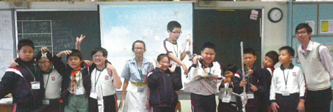
我的生命也要增高成長！！