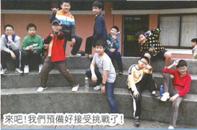
來吧！我們預備好接受挑戰了！