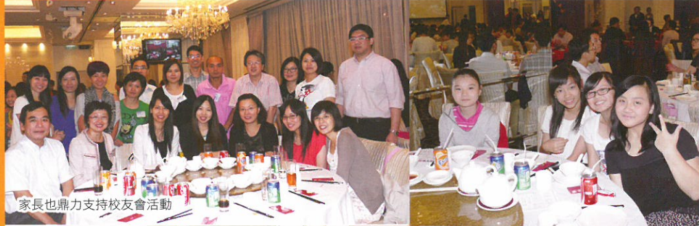
家長也鼎力支持校友會活動