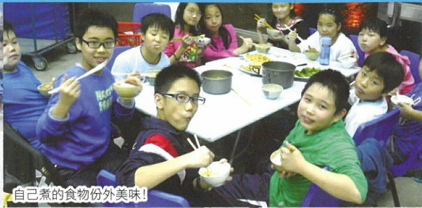
自己煮的食物份外美味！