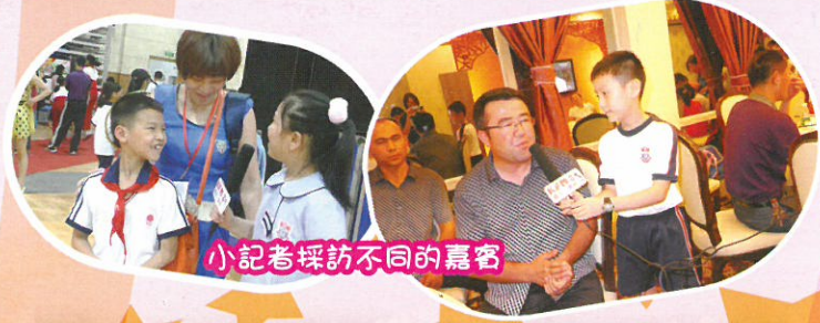
小記者採訪不同的嘉賓