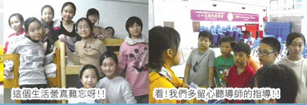
這個生活營真難忘呀！！