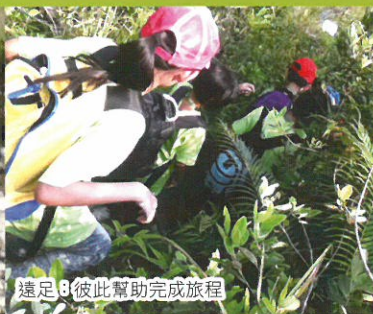
遠足，彼此幫助完成旅程