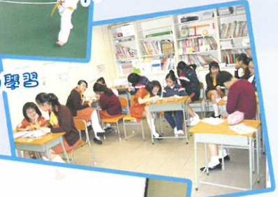
女童軍正在努力學習