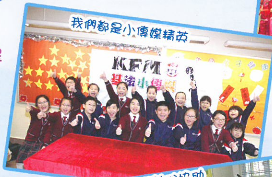
我們都是小傳媒精英