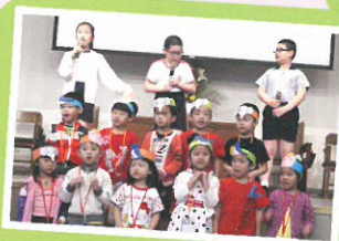
K3學生學習如何寫筆面及手冊，體驗小學生活