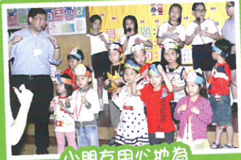
小朋友用心地為畢業表演排排