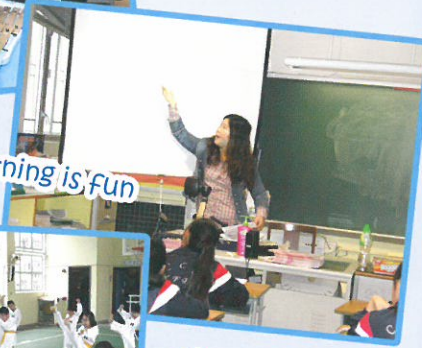
English learning is fun