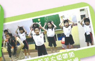
本校羊羊大使帶領小朋友一起做羊羊操