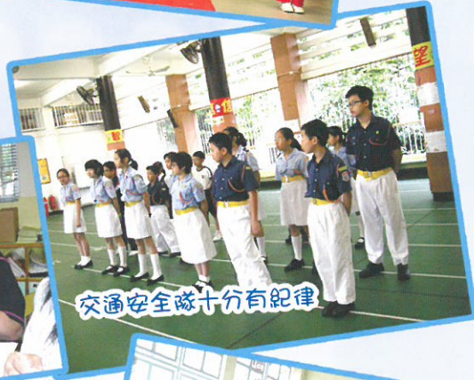
交通安全隊十分有紀律