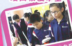
理財至叻Kid-生命之旅