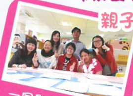
一同學習伴讀技巧