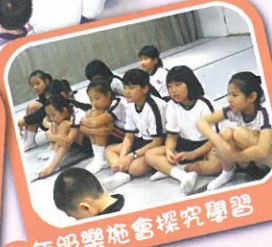
四年級樂施會探究學習