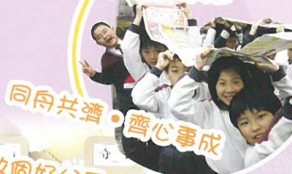
同舟共濟，齊心事成