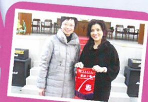
品格教育家長講座