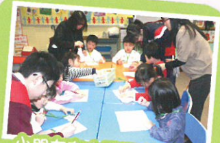
小朋友在大哥哥大姐姐協助下完成課堂活動

本年度「幼小銜接課程」已於五月份的四個星期六進行，約60名幼稚園生在「動物樂園」的主題下，分別在英語、數學、視藝和科學四大範疇中，渡過了四次愉快充實的學習體驗，最後一次更在畢業禮中，藉著表演展示他們的學習成果！更特別的是今年其中一部分的參加者是來年度的準小一生，是次課程向他們提供了將來於本校就讀的快樂經驗！故此，本年「幼小銜接課程」充滿了樂趣和意義！