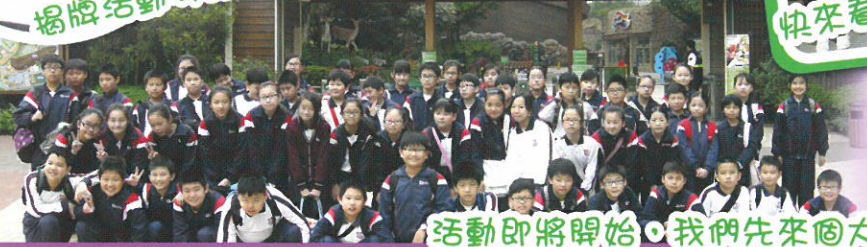
活動即將開始，我們先來個大合照！