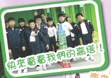
快來看看我們的高塔！