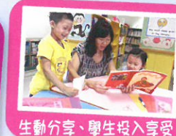
生動分享、學生投入享受