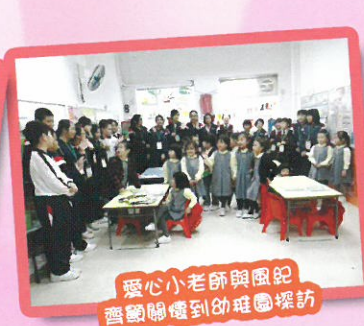
愛心小老師與風紀齊關顧到幼稚園探訪