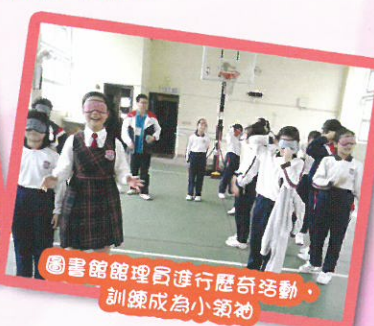
圖書館管理員進行歷史活動，訓練成為小領袖