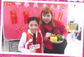
基法小團模報道 中華美食大賽