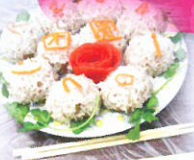
4B 雷雪玲家長 鄭玉問