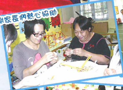
小廚神組：多謝家長們熱心協助