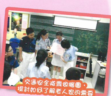
交通安全隊齊啟腦圖，探討如何了解老人家的需要