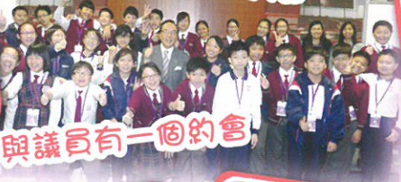
與議員有一個約會