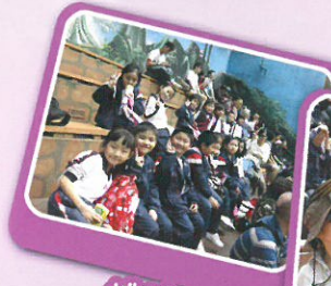
排排坐，等雀鳥出場

為配合學校本年度主題「生命果子健康孩子」，本校特為同學安排不同的全方位學習活動，為同學提供多元的學習經歷，創設有意義的學習情景，將知識融入生活，靈活運用。期望培養同學良好的品格，成為身、心、靈健康的孩子，為日後服務他人，貢獻社會作好準備。