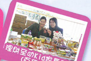
理財至叻Kid家長體驗 (百貨公司)