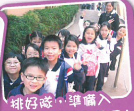
排好隊，準備入「山谷課室」上課了！