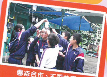
團隊合作、不棄放棄