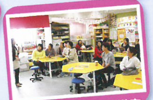
腦筋急轉彎家長講座