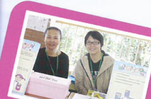
理財至叻Kid家長體驗 (愛心捐獻站及路路通)