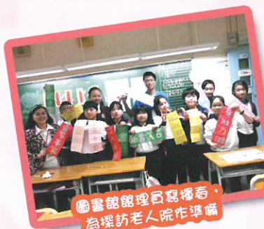
圖書館管理員寫掃帚，為探訪老人院作準備

訓練內容包括：講解義工訓練的目的及流程、認識服務對象、介紹服務对象的特性，透過分組討論、匯報、角色扮演、個案分析，讓領袖義工更了解服務對象。義工同學還親手製作小禮物，送給長者和幼稚園小朋友，又為他們表演，讓參與訓練的領袖義工發揮創意、愛心及合作精神。當領袖義工完成訓練和實踐過程後，導師與領袖義工同學檢討是次服務的意義及分享感受。這次領袖義工訓練看似畫上句號，但其實是同學們服務社群正展開新一頁呢！