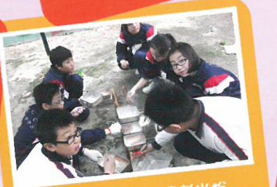
運用一粒炭精煮米粉