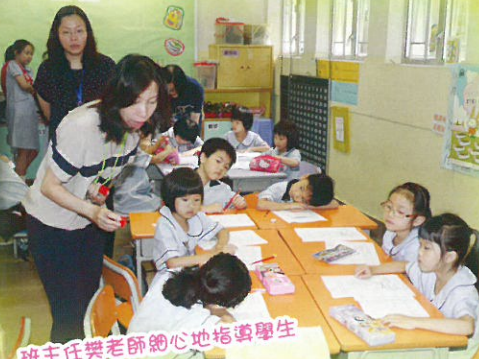
班主任樊老師細心地指導學生