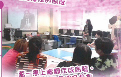
萬一患上腦癱症或病發， 如何有效地處理及急救

轉眼間，本校已舉辦了（優質家長學堂）接近三年，為家長提供更多機會認識子女情緒/行為/成長需要、學習與子女的溝通技巧，協助子女健康成長。在不同的家長講座、工作坊、家長小組、親子活動的過程中，充滿著許多美好又珍貴的回憶。有賴各位家長的積極投入及對活動的支持，活動能達致目標及順利進行。活動後家長也提供重要的回饋，協助活動改善及未來的家長活動。