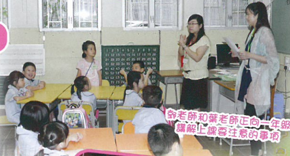
翁老師和葉老師正向一年級講解上課要注意的事項

本校於新學年前，讓小一新生能知道上學的情況，進行兩天的小一新生適應日。小一新同學認識任教的老師，知道了上課的要求，讓他們在新學年盡快適應小學生活。