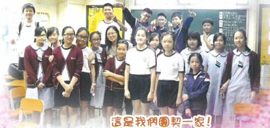
這是我們團契一家!

本年度學生團契更與本年度學校主題一致，讓同學在團契生活中活出「基督精兵·心獻社群」的生命，並邀得梁發堂鄭海傑宣教師及學校教師的同心配搭，讓同學得到更適切的照顧和關懷。