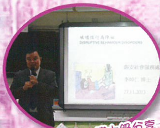
博士級分享—— 了解干擾性行為障礙