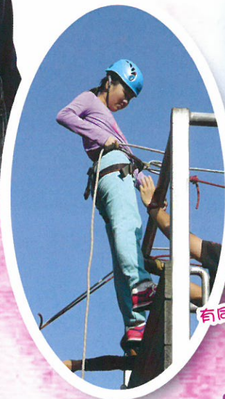
有同學的支持再高也不怕