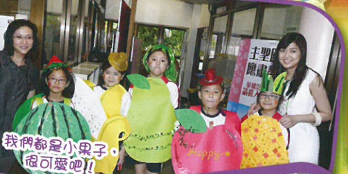
我們都是小果子，很可愛吧！