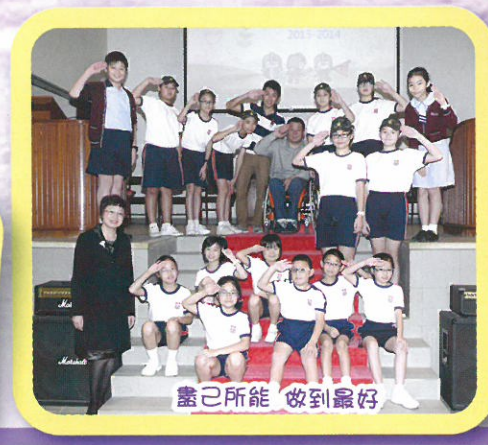
盡己所能 做到最好