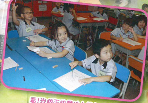
看！我們正快樂地上課！