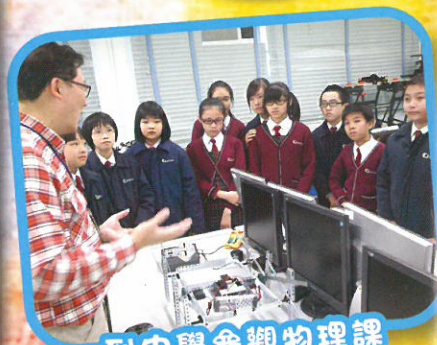
到中學參觀物理課