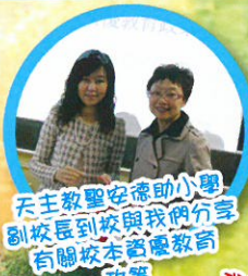
天主教聖安德肋小學 副校長到校與我們分享 有關校本資優教育 政策