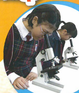
在參觀中學使用顯微鏡