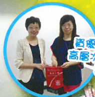
資優教育工作坊—— 高層次思考的教學策略 與課堂互動