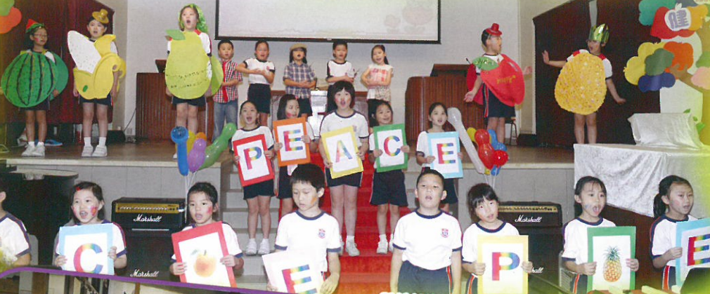
雖說我們年紀小，但我們一點都不怯場！

去年學校以「生命果子 健康孩子」為主題，期望同學能培養良好的品格，成為一個身心靈健康的孩子。我們舉行了課程統整成果展示日，當天不但設有攤位遊戲，還展出同學專題研習冊、全方位工作紙及各科課業，更有同學們精彩的專題及新加坡匯報，家長和同學的反應熱烈，現在就讓我們回顧一下當日的盛況吧！