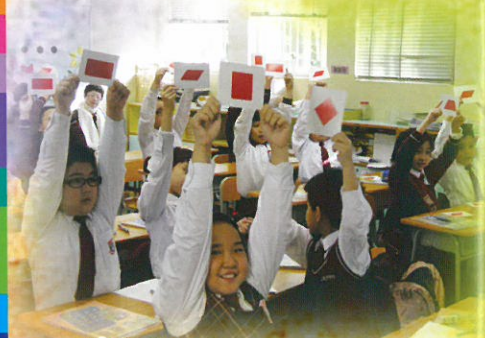
中大優化小班學習計劃：課堂學習