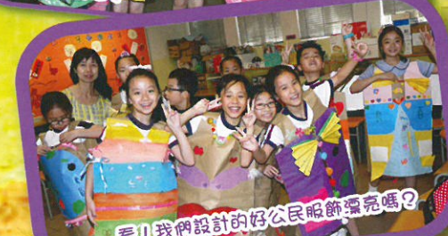
看！我們設計的好公民服飾漂亮嗎？