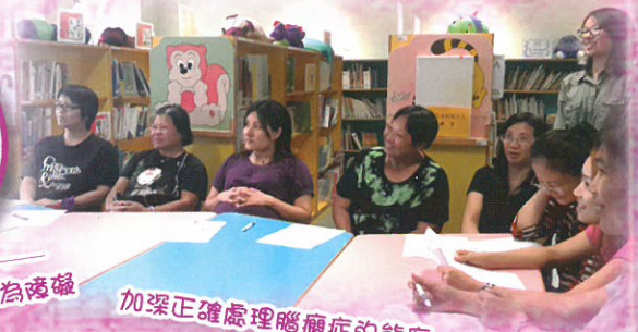
加深正確處理腦癱症的態度