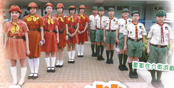
童軍在九東遊藝日服務