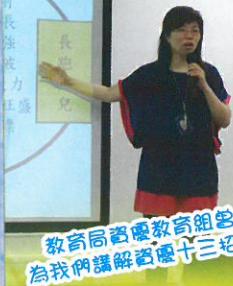
教育局資優教育組參小組 為我們講解資優十三招的應用