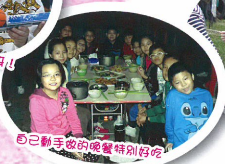
自己動手做的晚餐特別好吃