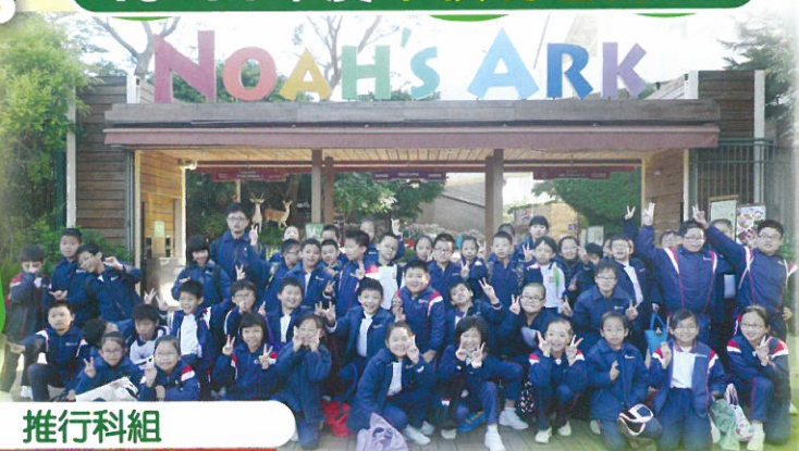
小四全方位學習：繪亞方向——「夢飛行」