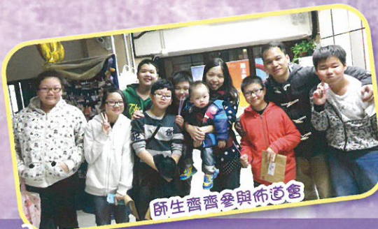
師生齊齊參與佈道會