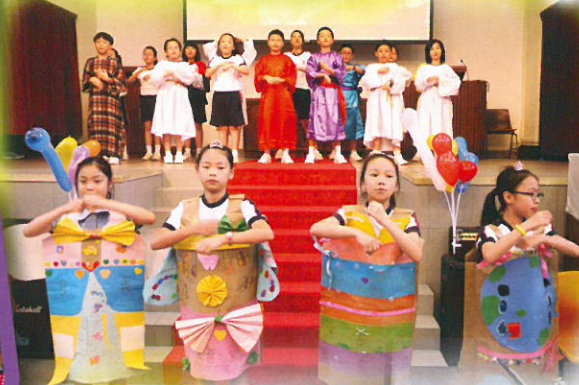
跳舞、話劇、catwalk show、歡歌歡舞樂無窮！