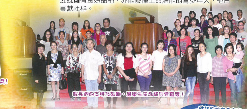
家長們的支持及鼓勵，讓學生成為精兵無難度!