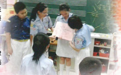
交通安全隊齊啟腦圖，探討如何了解老人家的需要