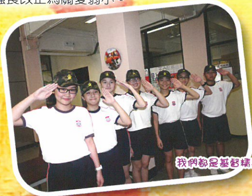
我們都是基督精兵!

在建立良好的品格方面，教會學校向來得到家長相當大的肯定，原因在於宗教信仰基本上也是導引人走在正途之上。再者，基督教信仰告訴我們，人唯有倚靠從神而來的能力才可改變許許多多的惡習。由此看來，我們並不單只在不同領域培育精英份子，我們更是建立基督精兵，讓一班既擁有良好品格，亦能發揮生命潛能的青少年人，他日貢獻社群。