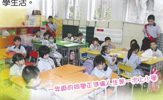
一年級的同學正準備人生第一次上小學