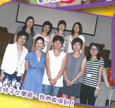
支持子女學習，我們改得到！