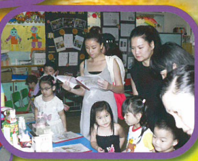
聚精匯神欣賞佳作