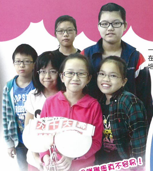
保護雞蛋真不容易！