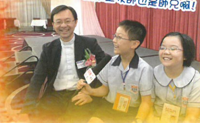
原來王牧師也是師兄嘅!

我們三位組員，於10月18日，戰戰兢兢地帶同採訪工具，到玉桃苑酒家工作。相比其他訪問，這次更需要我們有高度合作性。由拍攝、錄影、找訪問對象都是臨場工作。在訪問過程中，感謝很多師兄及長輩給我們的訓勉及鼓勵，實在獲益良多；現場的熱鬧氣氛，校友對學校的熱愛，更令我們心存感恩呢！