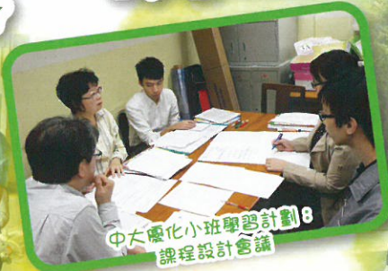
中大優化小班學習計劃8 課程設計會議