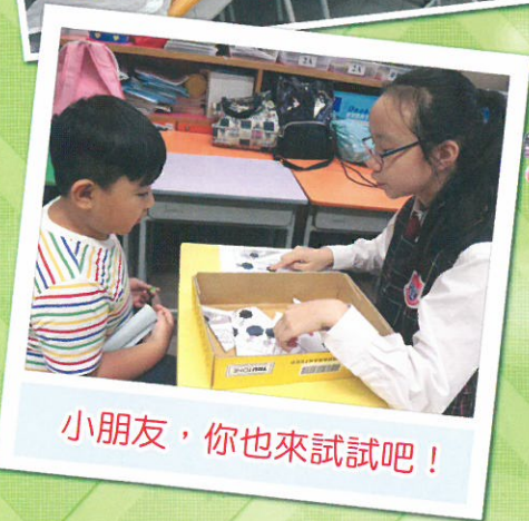
小朋友，你也來試試吧！