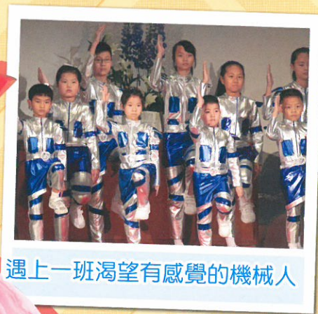
遇上一班渴望有感覺的機械人