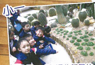
香港公園—看！這些都是仙人掌！