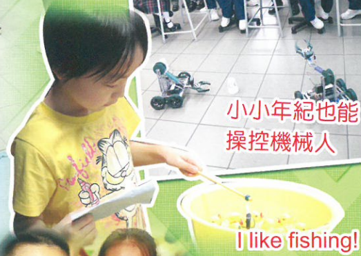
I like fishing!