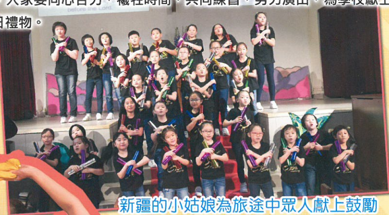
新疆的小姑娘為旅途中眾人獻上鼓勵