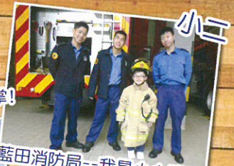
藍田消防局—我是小小消防員