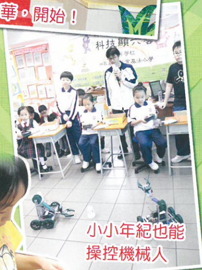
小小年紀也能 操控機械人