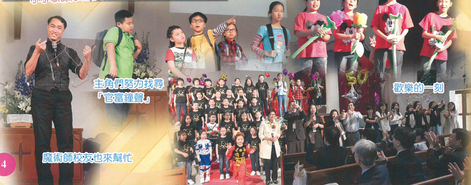
主角們努力找尋「官富鐘聲」