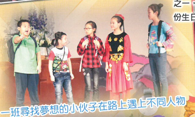
一班尋找夢想的小伙子在路上遇上不同人物