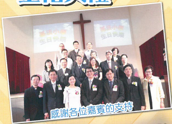
感謝各位嘉賓的支持

校慶劇各個表演項目原本來自多元智能課的組別，透過劇中主角的經歷，將校內已有的活動元素用話劇串連。故事講述一個住在基法村的小男孩，雖然沒有自信、記性又不好，卻是一個謙虛又喜愛閱讀的人。有一次，他在書中發現「官富鐘聲」具有令人願望成真、改掉缺點的神奇功能，決定出發尋找它，途中遇到不同的人，讓他領悟到能令他改善缺點的道理。創作理念是讓學生吸取正面信息。由於參與演出的同學佔全校三分之一，大家要同心合力，犧牲時間，共同練習，努力演出，為學校獻上這份生日禮物。