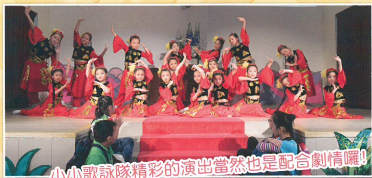
小小歌詠隊精彩的演出當然也是配合劇情囉！