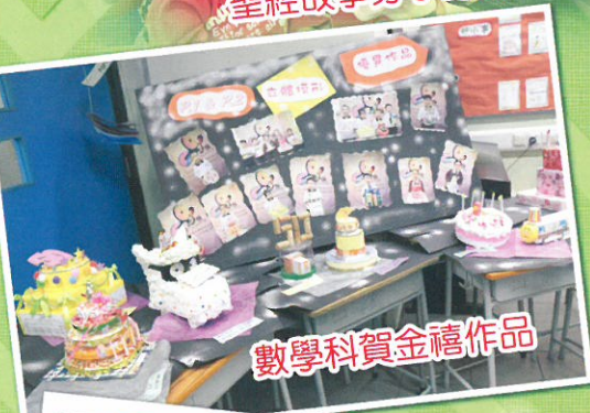
數學科賀金禧作品