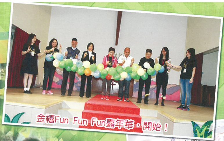
金禧Fun Fun Fun嘉年華。開始！