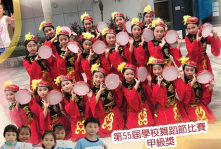
第55屆學校舞蹈節比賽 甲級獎