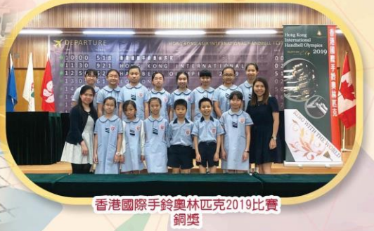
香港國際手鈴奧林匹克2019比賽 銅獎