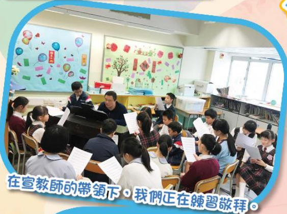
在宣教師的帶領下，我們正在練習敬拜。