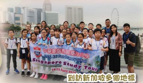
到訪新加坡多個地標