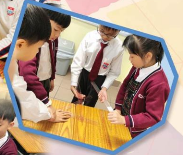
創作斷橋探究活動