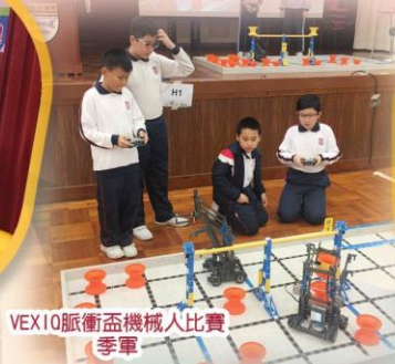
VEX IQ脈衝盃機械人比賽 季軍