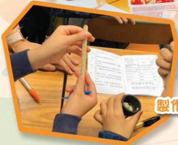
製作植物量度工具