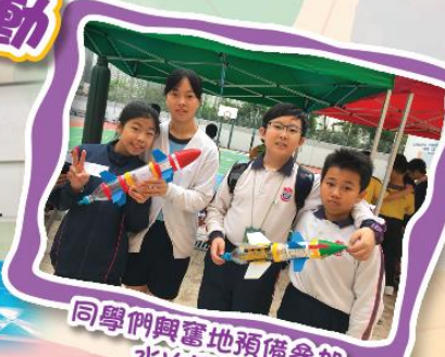
同學們興奮地預備參加水火箭比賽