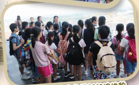
於最高公營住宅鳥瞰新加坡地貌