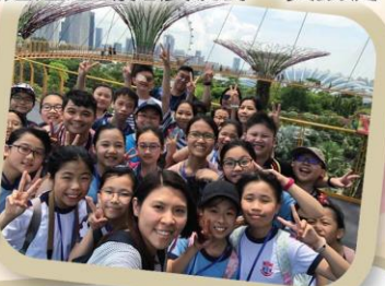
在高空欣賞新加坡的美景