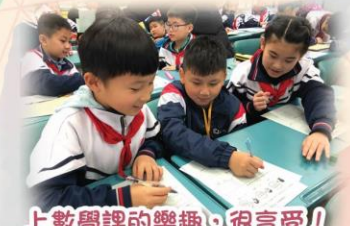
上數學課的樂趣，很享受！

本年度四年級學生於2019年3月6-8日到本校的內地姊妹學校（廣州市海珠區昌崗中路小學）進行交流，主題為「科學及有機耕種之旅」，學生們有機會參與書法課、語文課、體育課等，體驗不一樣的課堂。除了到訪「廣州科學中心」，學生更參觀了當地的有機農場，品嚐新鮮的水果。整個交流活動既能豐富學生的學習經歷，又能擴闊視野，認識內地文化，讓他們獲益良多。