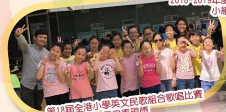
第18屆全港小學英文民歌組合歌唱比賽 優良表現獎