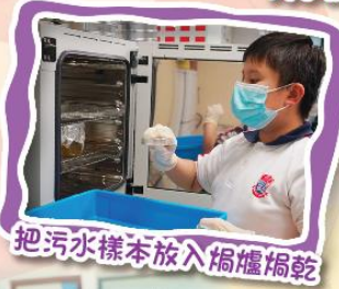
把污水樣本放入焗爐焗乾