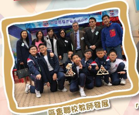
區會聯校教師發展