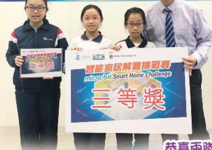
恭喜兩隊同學得到獎項！