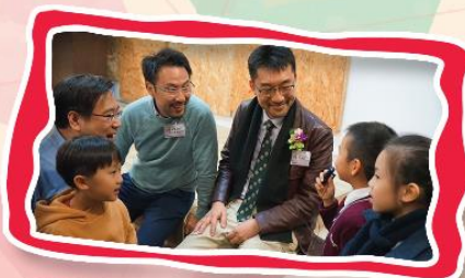
基法小傳媒正在訪問校監和校友

一年一度的校友會聚餐已於十二月十四日順利舉行，感謝各位校友踴躍參加，大家都享受了一個愉快的晚上。