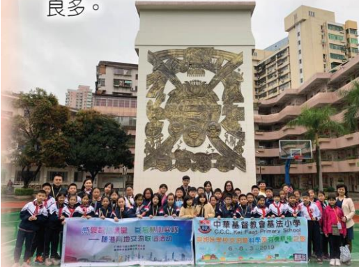
在姊妹學校和眾人留影