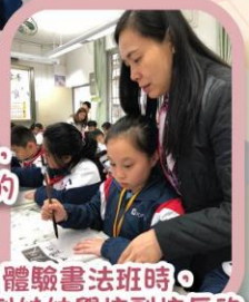
體驗書法班時，得到姊妹學校副校長的親身指導