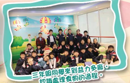
三年級同學來到益力多廠，認識處理食物的過程。