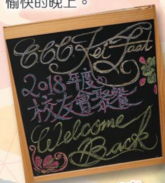
歡迎各位校友 回來母校!