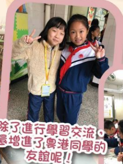
除了進行學習交流，還增進了粵港同學的友誼呢！