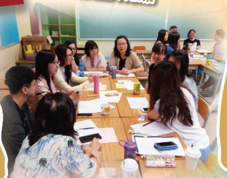
教師討論 「如何在課程中融入發展學生創意的的方法」