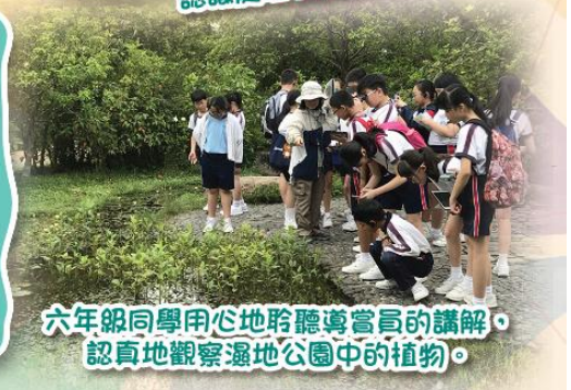
六年級同學用心地聆聽導賞員的講解，認真地觀察濕地公園中的植物。