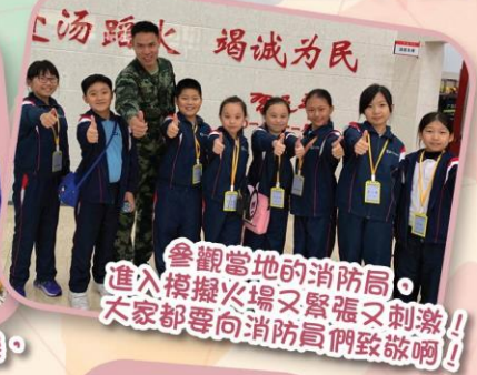
參觀當地的消防局，進入模擬火場又緊張又刺激！大家都要向消防員們致敬啊！