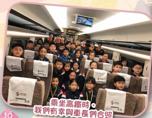
乘坐高鐵時，我們有幸與車長們合照