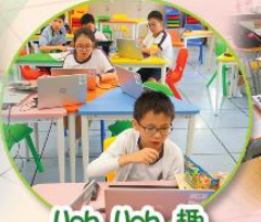
Web Web 趣