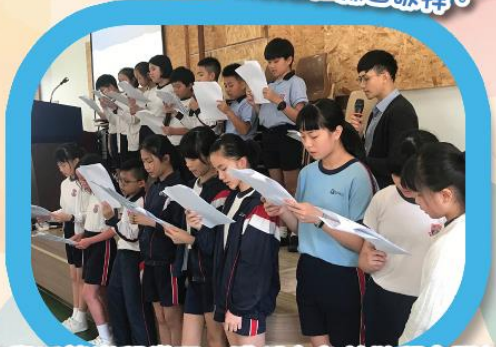
在復活節崇拜當天，我們在台前敬拜主耶穌。

臨近學期尾，六年級的同學即將畢業，我們來年可能會各散東西。不過，無論分隔多遠，我們都深信着，我們仍然能夠在主內連結，在主內彼此代禱，在主內結出聖靈的果子。