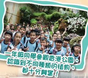
一年級同學參觀香港公園，認識到不同種類的植物，都十分興奮！

常識科為學生安排多元化的學習活動，讓學生應用不同的知識、能力及價值觀和態度進行學習。在STEM方面的發展，除了小三的水耕種植及小四的魚菜共生課程外，其餘各年級也在課堂中進一步加強認識科學的應用和科學與日常生活的關聯。此外，學生亦參與不同的比賽，透過動手做，讓學生經歷解決問題的過程，培養學生的創造力及探究精神，發展學生「學會學習」的能力。每年的全方位學習，讓學生在真切情境和實際環境中學習，令學生更有效地掌握一些單靠課堂學習難以達到的學習目標。