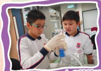
小心翼翼地過濾污水樣本