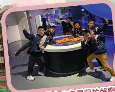
在廣州科學中心寓學習於娛樂，大家都表情多多呢！