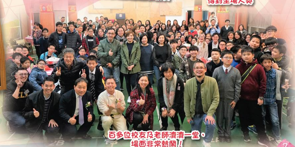
百多位校友及老師濟濟一堂， 場面非常熱鬧!