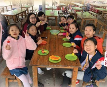
老師和同學們享用新鮮的水果