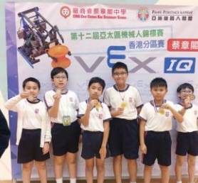
第12屆亞太區機械人錦標賽 3金獎、3銀獎