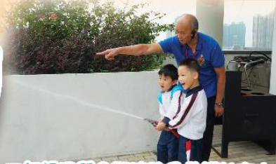
三年級同學參觀消防及救護教育中心，在導師指導下「救火」。