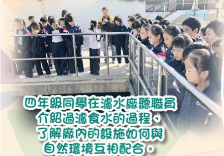
四年級同學在濾水廠聽職員介紹過濾食水的過程，了解廠內的設施如何與自然環境互相配合。