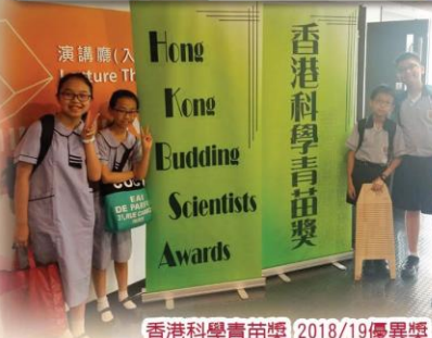
香港科學青苗獎 2018/19優異獎