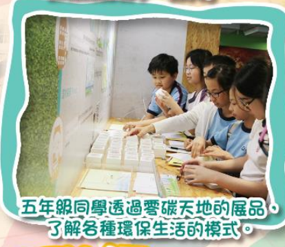
五年級同學透過零碳天地的展品，了解各種環保生活的模式。