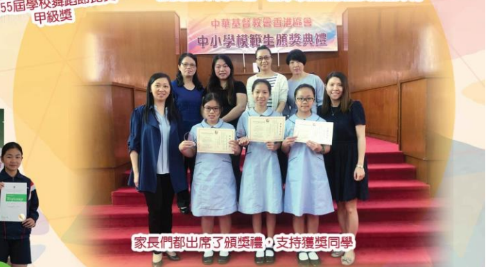
家長們都出席了頒獎禮，支持獲獎同學