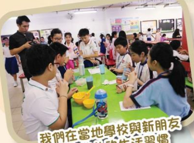
我們在當地學校與新朋友交流彼此的生活習慣