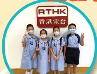
本校四位學生接受香港電台《玩玩星期天》的節目訪問，暢談喜歡的水上活動