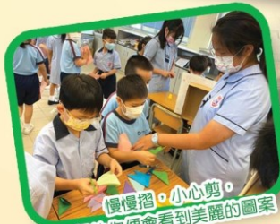
慢慢摺，小心剪。 很快你便會看到美麗的圖案