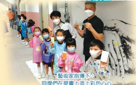
藝術家指導下，同學們在壁畫上添上彩色心心