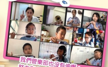
我們管樂部也沒有偷懶，努力在 ZOOM 課堂止合奏