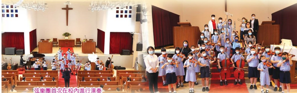
弦樂團首次在校內進行演奏