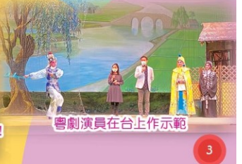
粵劇演員在台上作示範