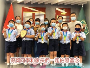
得獎同學和家長們一起拍照留念

「迎國旗、奏國歌」計劃為了讓香港的教師和學生認識升國旗及奏國歌的禮儀，建立起對國家的歸屬感，活動以學習國旗的基本知識、持旗及懸掛國旗的方法、升旗儀式的步驟，及其他需要注意的事項，以助學校推行升國旗及奏國歌的活動。