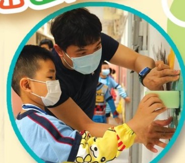
師生互相合作為單調的畫面增添色彩