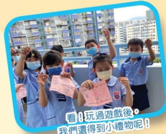
看！玩過遊戲後， 我們還得到小禮物呢！