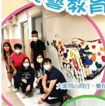
大家同心同行，樂在其中