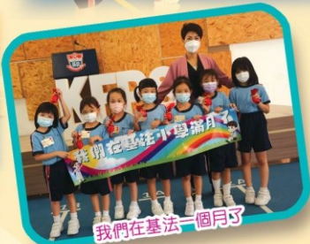
我們在基法一個月了