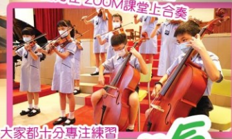
大家都十分專注練習