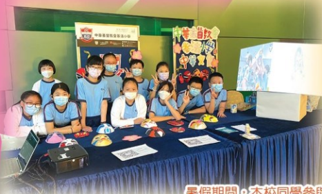
暑假期間，本校同學參與第四屆光雕節，分享製作成果！