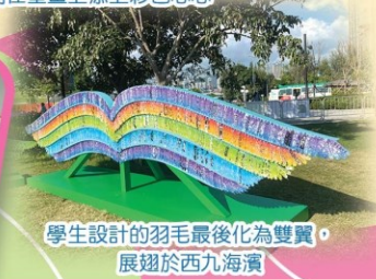
學生設計的羽毛最後化為雙翼，展翅於西九海濱