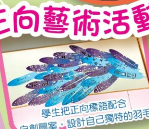
學生把正向標語配合自創圖案，設計自己獨特的羽毛