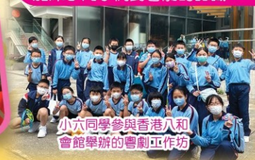
小六同學參與香港八和 會館舉辦的粵劇工作坊