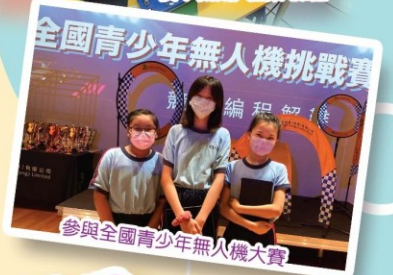
參與全國青少年無人機挑戰賽