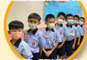
學排隊，做個守規小一生