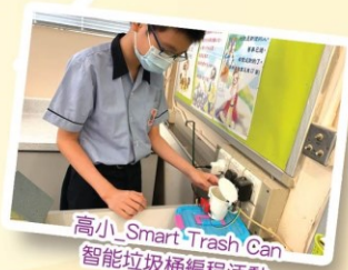
高小 Smart-Trash Can 智能垃圾桶編程活動