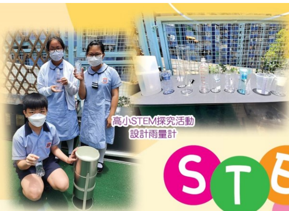
高小STEM探究活動 設計雨量計