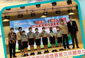
得獎同學及負責老師與頒獎嘉賓范徐麗泰女士、教育局副局長蔡若蓮女士及前香港警務處長李明達先生合照留念