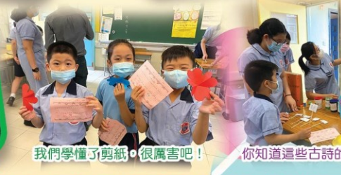
我們學懂了剪紙，很厲害吧！