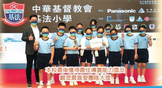
本校最後獲得最佳導賞能力獎及觀眾最喜愛團隊大獎