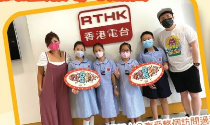
節目主持人十分風趣，我們都十分享受整個訪問過程！能夠踏上錄音間，實在是難能可貴的經驗！