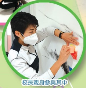
校長親身參與其中