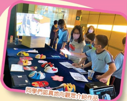
同學們認真地向觀眾介紹作品

本校光雕藝術尖子成員於2021年8月7日到香港數碼港參與「第四屆光雕節」。當天，本校同學向評審及觀眾介紹他們的創意意念，並展示光雕學習成果，獲得全場掌聲。面對提問同學亦應付自如，最後奪得「最佳導賞能力獎」及「觀眾最喜愛團隊大獎」，現在就讓我們重溫當天的精彩片段。