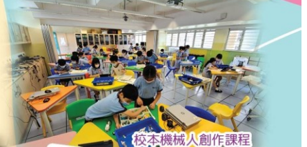
校本機械人創作課程