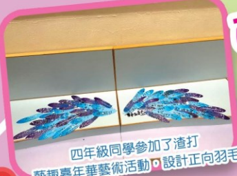
四年級同學參加了渣打藝趣嘉年華藝術活動，設計正向羽毛