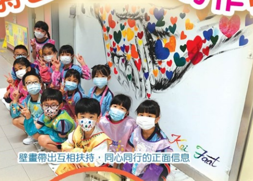
壁畫帶出互相扶持，同心同行的正面信息