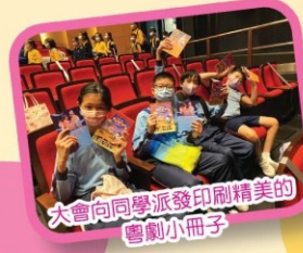
大會向同學派發印刷精美的 粵劇小冊子