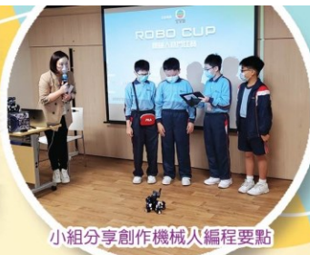
小組分享創作機械人編程要點