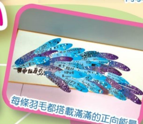
每條羽毛都搭載滿滿的正向能量