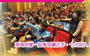
現場同學一起學習蘭花手，十分投入！